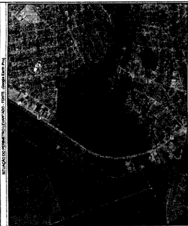
SITUAÇÃO DO PÊRIMETRO LEVANTADO

PROJEÇÃO UNIVERSAL TRANSVERSA DE MERCATOR - UTM ZONA 18S ESCALA 630000 VERTEICE: MT LLA 174°11'38" S LLA 174°11'38" W K 1000000 Q 648514688 CH: 5583335445 no Sudeste com o tempo atual de -0'02"20"